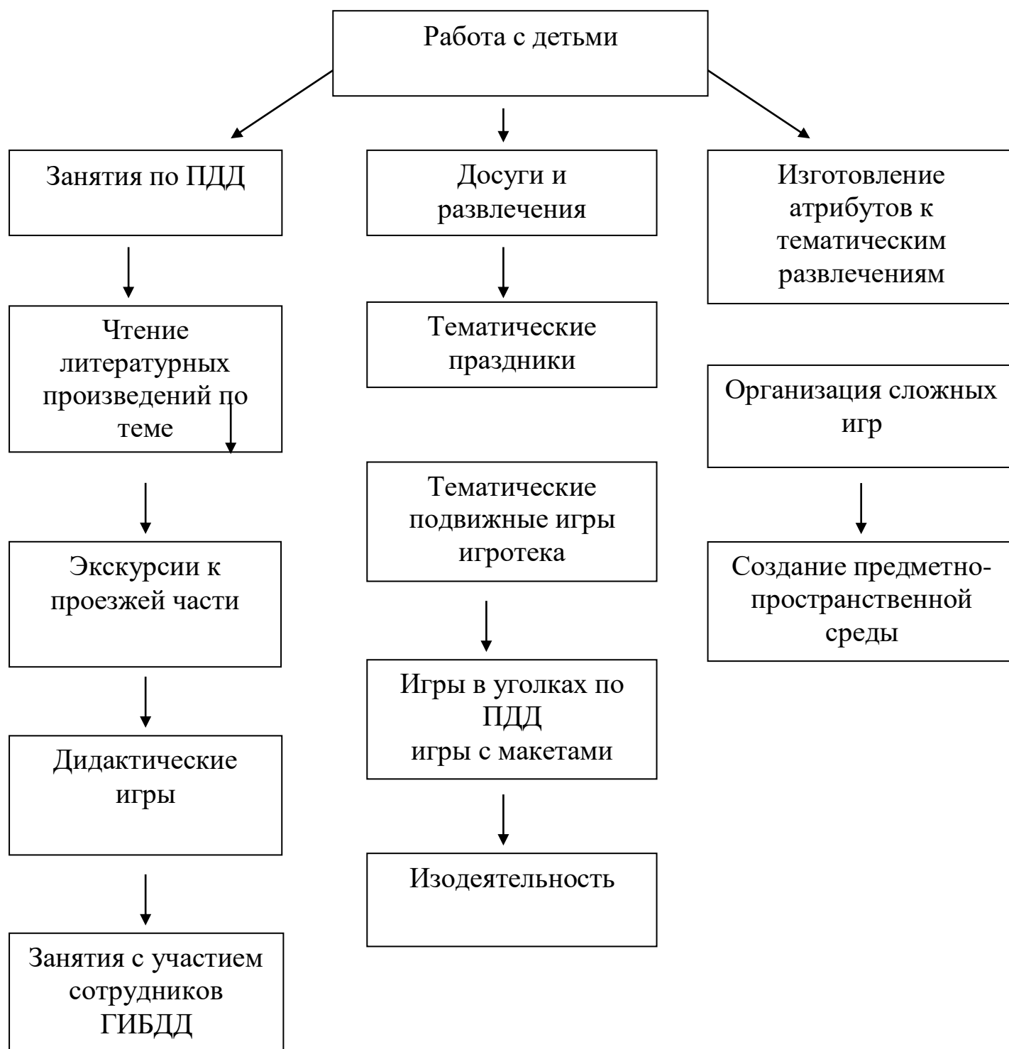
Схема «Система работы по формированию у детей навыков осознанного безопасного поведения на улицах и дорогах города»

Педагоги I младшей группы ведут работу, направленную на развитие у детей ориентировки лишь в привычной для них обстановке. В течение года детей учат различать виды транспорта, части автомобиля.